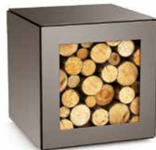
Range bûches 50 x 50 x 50 cm