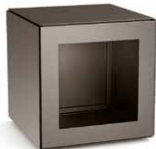
Rangement 50 x 50 x 50 cm

Une box de rangement a été spécialement optimisée pour le stockage du bois de chauffe. Utilisée en tabouret agrémenté d'un coussin ou comme étagère ou bibliothèque dans une composition de plusieurs modules, cette box peut également accueillir vos livres et vos objets préférés.