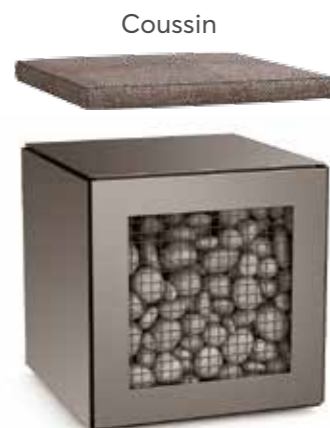
Accumulateur de chaleur 50 x 50 x 50 cm

Une box accumulateur équipée de galets emmagasine la chaleur pendant le temps de chauffe afin de la restituer progressivement pendant plus de 8h après l'arrêt du poêle, contre seulement quelques heures pour une cheminée ou poêle à bois classique.